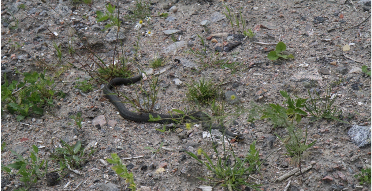
Bild 6. Vanlig snok.