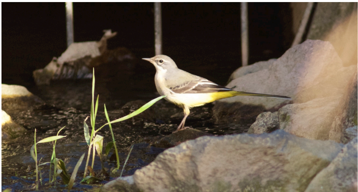
Bild 18. Forsärlan är en av arterna som är knutna till rinnande vatten på Kikås.

En mindre vattensamling vid södra delen av område 4 lockade till sig en snok som blev störd vid besöket och ringlade in i det höga gräset nedanför den närliggande kullen.