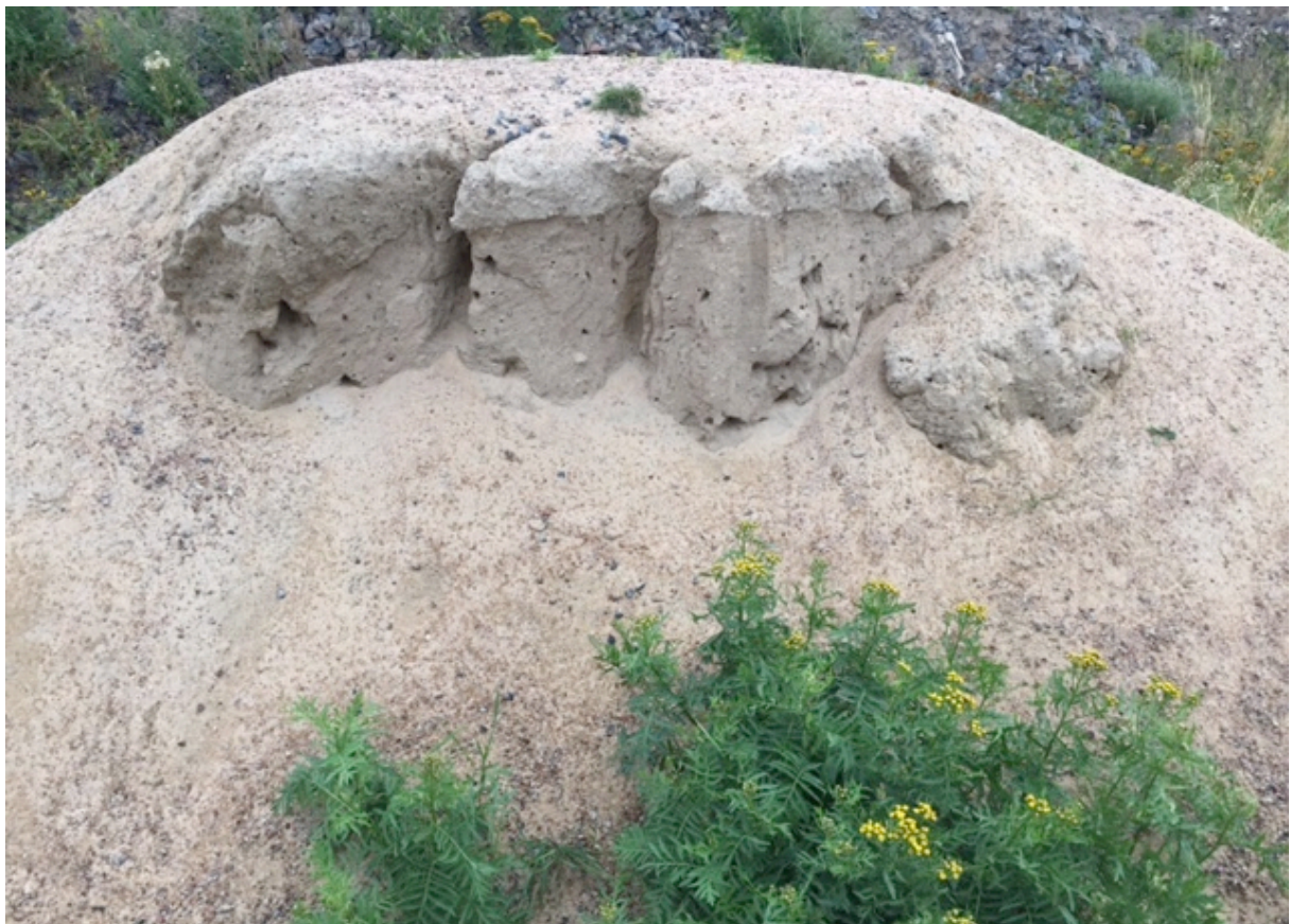
Bild 9. Ett lastbilslass med finkornig sand som för stå orört en tid skapar bra miljöer för marklevande bin. För att förhindra att sandhögen rasar sönder vid kraftiga regn kan man sätta upp ett tak över sandhögen.

Cirka en tredjedel av solitärbina, parasitbina undantagna, bygger bo i gångar efter vedlevande insekter, i vasstak eller i konstgjorda biholkar av olika slag eller i andra håligheter, naturliga eller av människan skapade (se tabell 3). Dessa boplatser bör vara solexponerade och ej mer än tillfälligt utsatta för kraftig vind eller regn. I dag tillåts inte död ved i synnerhet inte insektsangripen sådan vara kvar i lika stor utsträckning i våra skogar eller trädgårdar.