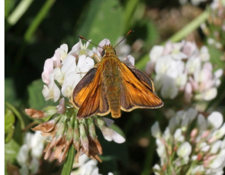
Bild 4. Ängssmygare på vitklöver

För övrigt var det bara enstaka eller fåtaliga antal individer av följande arter; hedblåvinge, mindre guldvinge, näselfjäril, påfågelöga, amiral och ängssmygare.