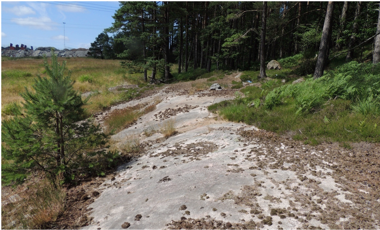
Bild 17. Kantzonen vid område 18B.