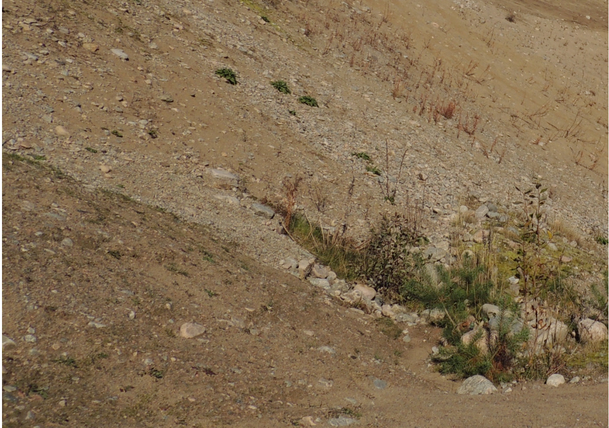
Bild 20. Minisavannen ska vara torr, solbelyst och bestå av lite grövre grus med inslag av stenar med sparsam lågvuxen växtlighet.