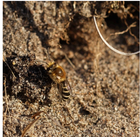
Bild 8. Ljungsandbi vid sitt bo.

Men för att vildbin ska lyckas med sin reproduktion krävs det också att det inom flygavstånd även finns nektar och pollen i tillräcklig mängd under artens flygperiod.