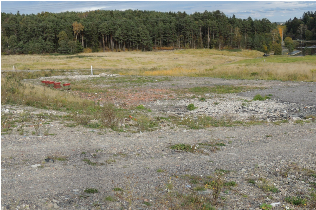
Bild 16. Idag är bikiporna placerade på område 14 men dessa ska flyttas till område 15. Här skapas istället en minisavann i sydväst läge.