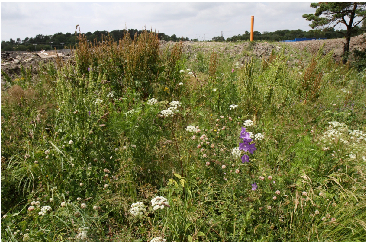
Bild 2. I kantzonerna finner man redan idag en spännande flora.

Det är i första hand strukturer och förutsättningar som inventerats och utretts för att se vilka möjligheter det finns med de givna förutsättningar som råder vid Kikås att skapa miljöer som gynnar de arter och artgrupper som kan tänkas etablera sig i denna miljö. Därför har också en översiktlig inventering av vissa insektsgrupper, framförallt bin Apoidea och dagfjärilar Lepidoptera utförts men också fladdermöss Chiroptera och fåglar Aves har inventerats. Övriga intressanta observationer med naturvärde har också noterats.