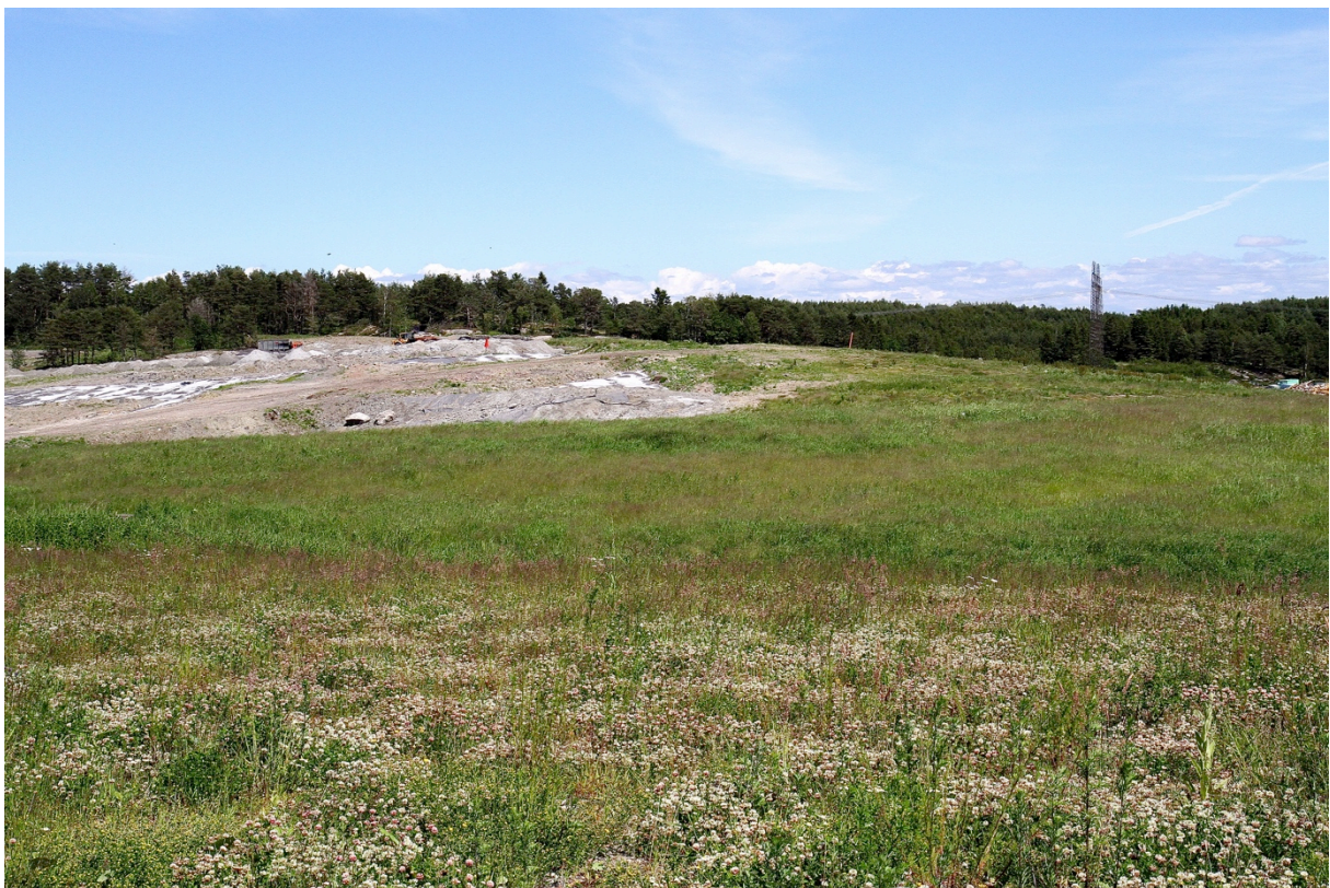
Bild 1. Vy över Kikås mot nordost. Böljande gräsmarker breder ut sig på de redan sluttäckta delarna.

Kikås avfallsanläggning är belägen i östra delen av Mölndal stad och är drygt 32 ha stort. I direkt anslutning ost/sydost om verksamhetsområdet ligger Rambo mosseområdet med en spännande flora och fauna. Rambo mosseområdet är föreslaget som ett blivande naturreservat. Söder om verksamhetsområdet ligger Horiskan (Hörickan) och på norra sidan ligger Södra Långvattnet som båda är välbesökta badsjöar. Lite längre norrut återfinns den välbesökta Gunnebo parken med gamla ädellövskogar, sumpskogar och flera nyckelbiotoper. En luftburen kraftledning korsar östra delen av Kikås avfallsanläggning i nord-sydlig riktning.