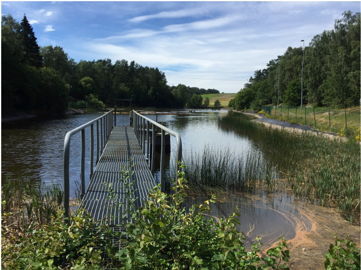
Bild 22. Lakdammen sedd från östra sidan.

Förorenat vatten leds idag ner till lakdammen där en vis rening, sedimentering och luftning sker innan vattnet leds vidare till Vällsjön via Vällbäcken genom Rambodal. Vattnet passerar en del fuktigare sumpskogsområden. Området Rambodal nedströms lakdammen har inventerats och en naturvärdesbedömning har gjorts med syfte att undersöka förutsättningen att anlägga en våtmark/kvävefälla för att ytterligare rena vattnet innan det når Vällsjön.