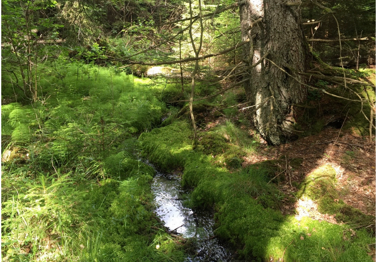
Bild 23. Höga naturvärden nedströms Vällbäcken.

Den östra delen av bäckfåran innan gränsen till Härryda kommun ingår i länsstyrelsens inventering av sumpskogar i länet. Ett flertal rödlistade arter fåglar har observerats i området, Vid inventeringen observerades bland annat entita (LC), kungsfågel (VU) men även järpe B stöttes, en art som är mycket ovanlig i Göteborgsområdet. Även spår av hackspettar sågs talrikt och gröngöling (NT) observerades vid flera tillfällen. Bedömningen är att Rambodal uppfyller kriterierna för naturvärdesklass 2 3 .