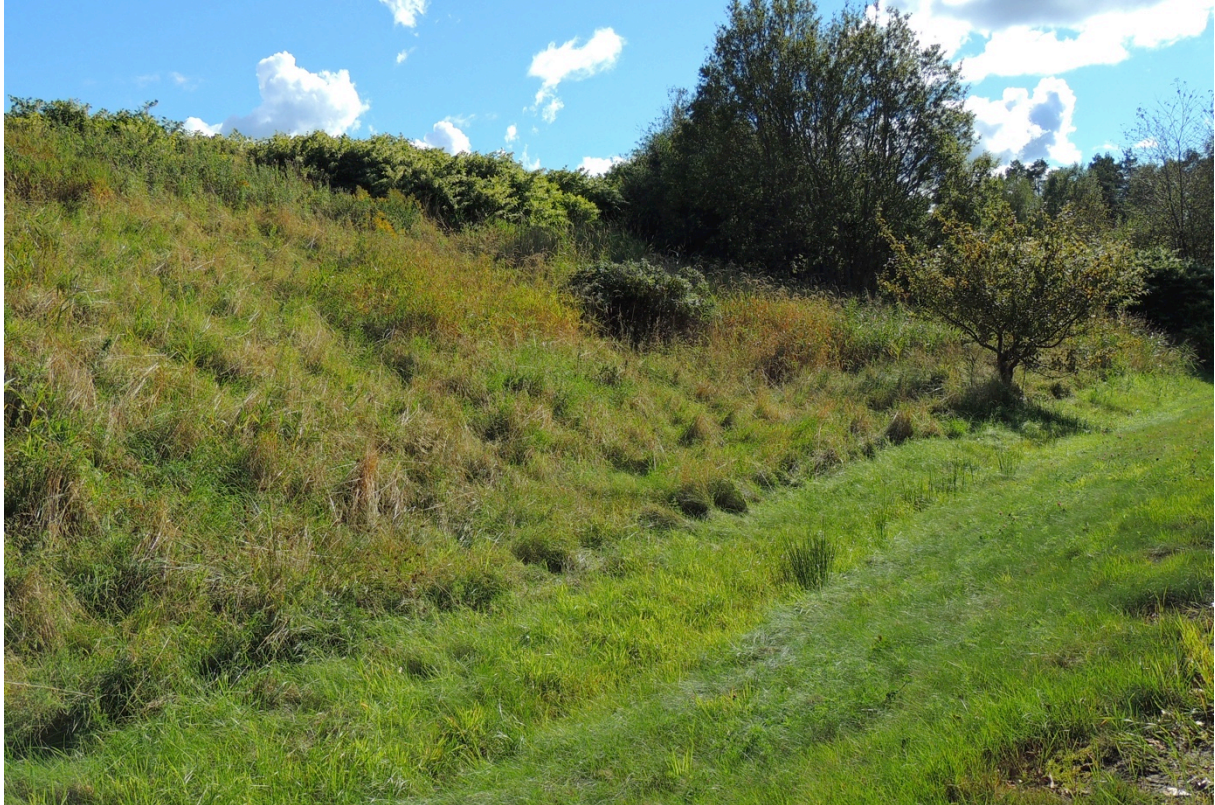
Bild 13. Vägslänten med parkslide i övre vänstra hörnet av bilden.