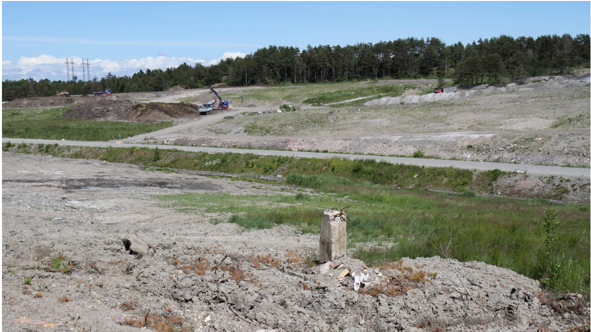
Bild 14. Översiktsbild över område 4 & 5 vilka håller på att sluttäckas. I förgrunden område 2.