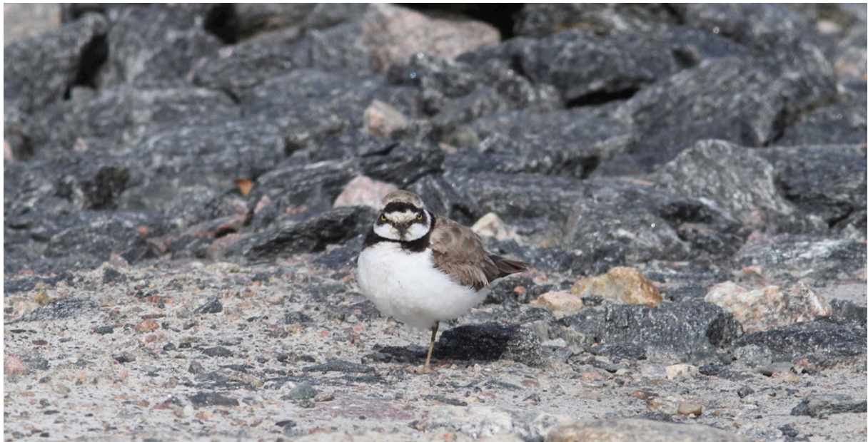
Bild 5. Mindre strandpipare.

Övriga observationer av fåglar utanför häckningstid som skulle kunna etablera sig i området är mindre hackspett (NT) stare (VU) sånglärka (NT) gulsparv (VU) sävsparv (VU) och ängsplärka (NT).