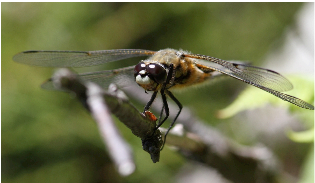
Bild 7. Fyrfläckad trollslända

Någon egentlig inventering av sländor har inte gjorts. Trots detta observerades ett flertal arter som fotograferades och artbestämdes. Troligen missades flera arter varför antalet arter som förekommer på Kikås är större än vad som här redovisas. Trollsländor har liksom många andra insekter speciella flygtider, några arter så korta som bara några veckor varför det är lätt att missa många arter när man inte genomför en heltäckande inventering av just trollsländor.