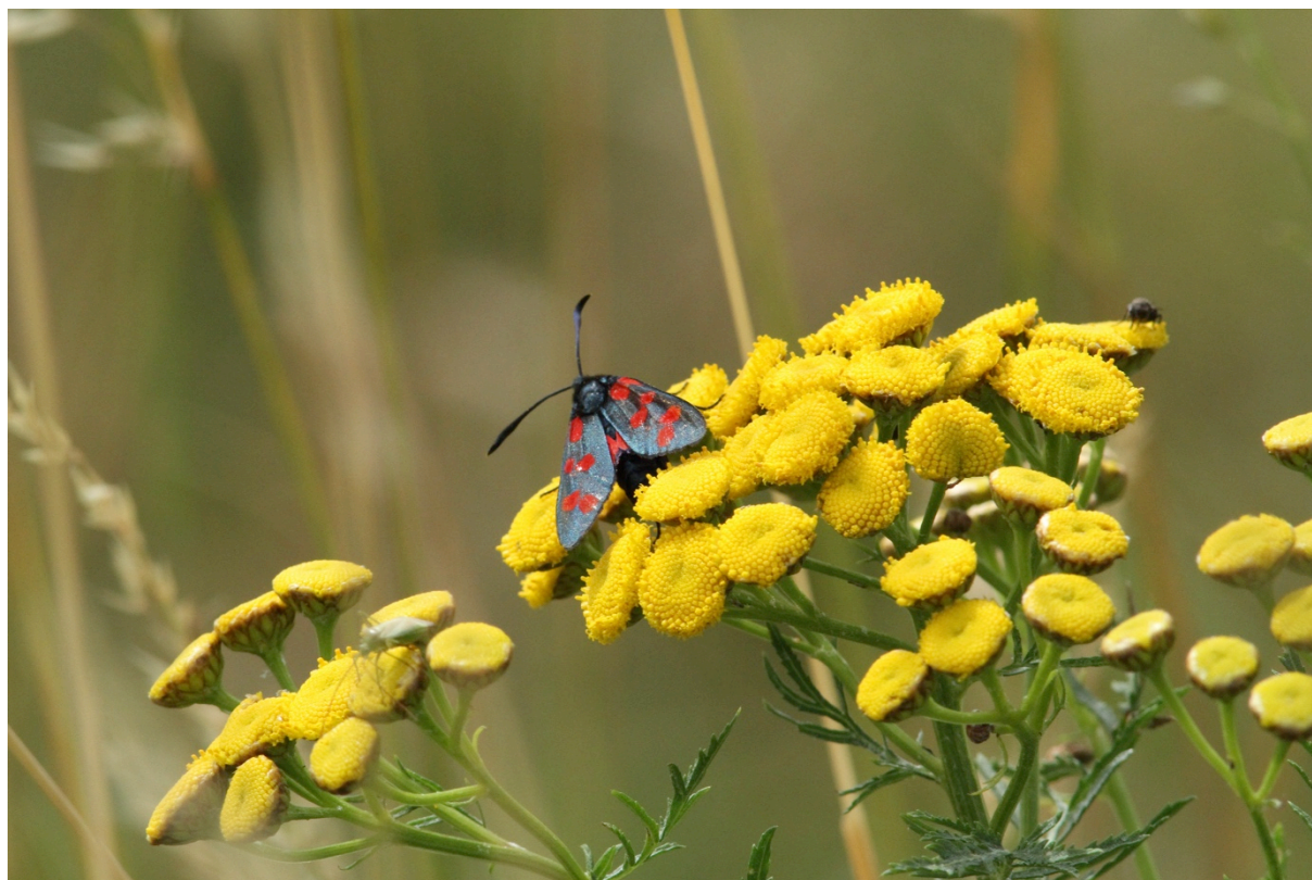
Bild 3. Sexfläckig bastardsvärmare.

I naturvårdsplanen för Mölndals stad uppmärksammas vikten av mångfalden av arter, naturtyper de lever i men också ekosystemtjänsterna som erbjuds. Här kan man också läsa att "Ovanliga naturtyper som hyser en unik flora och fauna bidrar till en hög biologisk mångfald och skydd och restaurering av sådana miljöer är viktiga naturvårdsåtgärder." Detta är också målet vid Kikås.