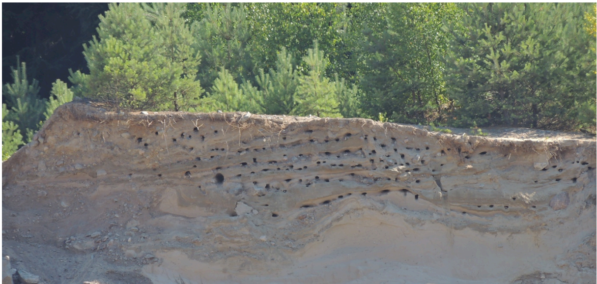
Bild 15. Boplatser för backsvalar är väldigt enkla och tacksamma att skapa.