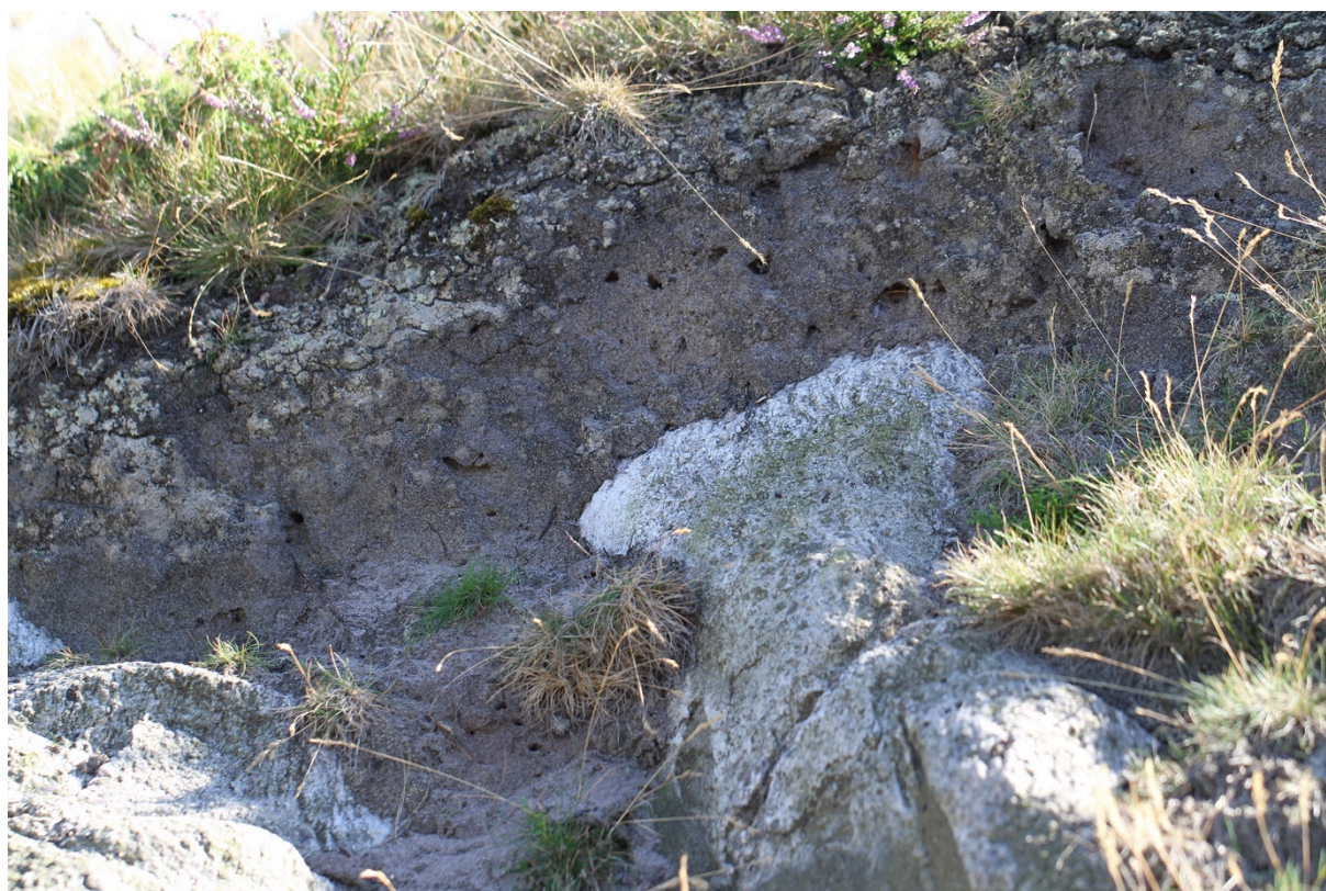
Bild 10. En vertikalskärning i sandjord orsakad av kornas trampskador lockar flera arter av marklevande bin.

** En socioparasit parasiterar på sin värds sociala struktur – snylthumlornas larver matas av värdhumlans arbetare.