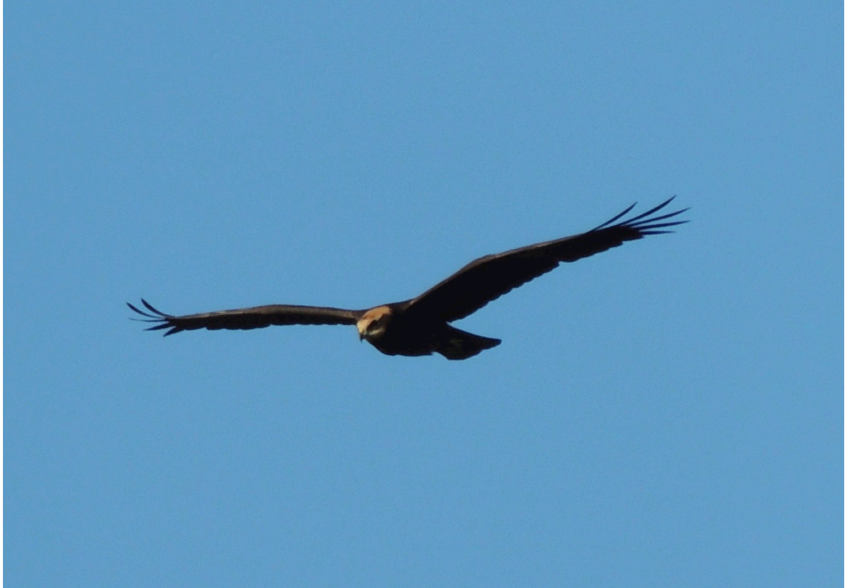
Bild 12. Brun kärrhök ses ibland jaga över Kikås.