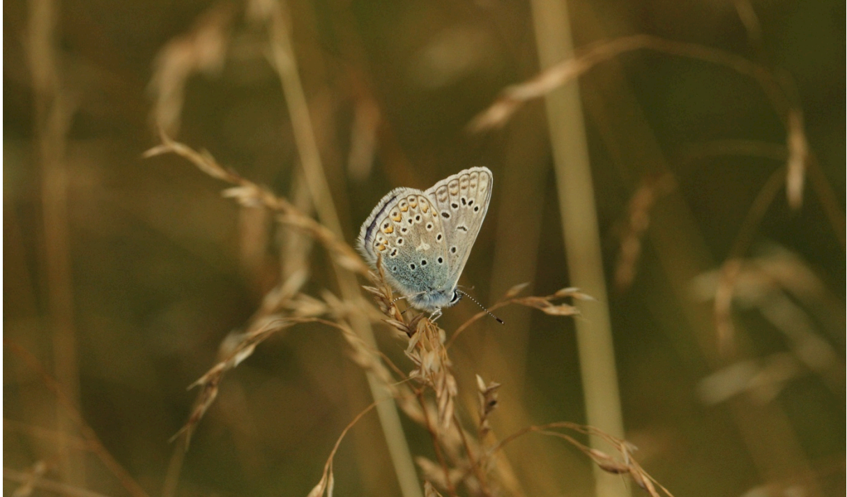
Bild 11. Puktörneblåvinge.